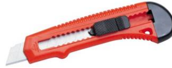
18mm 70 Plástica Traba dentada Caja x