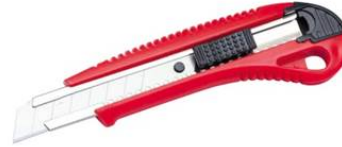
18mm 2 Plástica Traba dentada Con guía metálica Caja x