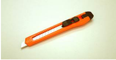
9mm 122 Plástica Traba dentada Caja x