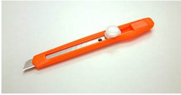
9mm CTE (100) Plástica Traba a rosca Caja x 60/1200